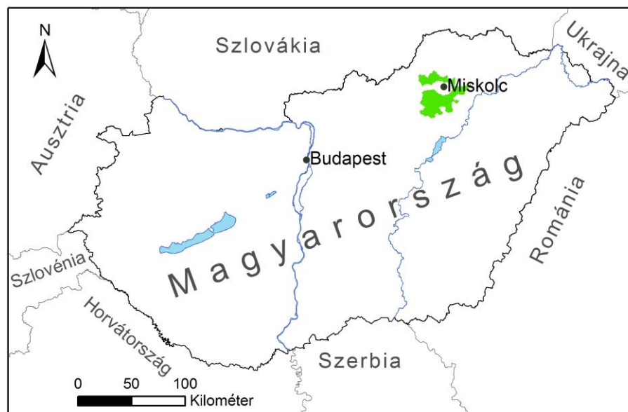
1. ábra: A kutatási terület

Az energiatárolási lehetőségek tudományos vizsgálata kutatási projektünkben több mintaterületen is folyik, ezek közül jelen dolgozat a Bükk LEADER térségre fókuszál. A 925,62 km 2 -es területen elhelyezkedő 42 település a Bükk keleti, Borsod megyei felében található (1. ábra), közös jellemzőjük, hogy a megújuló energiaforrások alkalmazására kisebb-nagyobb léptékben mindegyik településen található példa – hiszen 2010-től ez kiemelt célfeladata volt a LEADER fejlesztéseknek. Csaknem minden településen található valamilyen napelemes alkalmazás, sőt elektromos autók töltésére szolgáló állomásokból is akad 25 – igaz, ezek tervezése, kivitelezése döntő többségében sajnos nem felel meg a követelményeknek (mert közülük sok elzárt helyen, épületeken belül van).